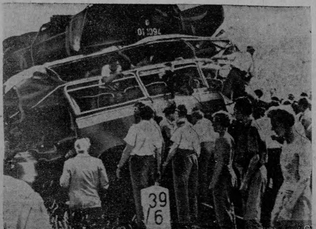
33 MUEREN EN CHOQUE.—Trabajadores rescatan de los restos de un autobús a 33 personas que murieron cuando un tren se estrelló contra el vehículo en Lauffen, Alemania. Otros 29 pasajeros fueron lesionados, algunos de gravedad. El accidente ocurrió en un cruce.

"En relación con declaraciones dadas por el periodista Jules Dubois, sobre supuestos malos tratos a Pedro J. Chamorro, prisionero en las cárceles de Managua, (la Secretaría) declara enfáticamente que tales noticias son absolutamente falsas. Chamorro guarda prisión junto con otros tantos compañeros de aventura en los recientes sucesos, y recibe tratamiento humano. Cabalmente, una declaración de la Cruz Roja Internacional, por deseos del Presidente Luis A. Somoza, visitó las cárceles para comprobar el