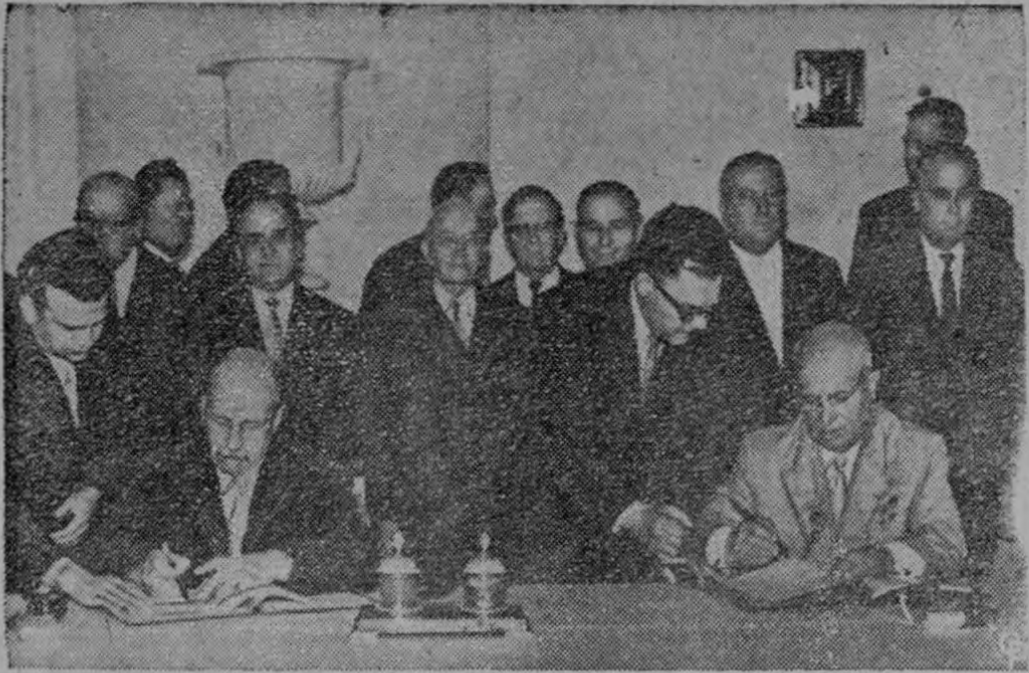
TERMINA VISITA DE COMUNISTAS ALEMANES.—Terminada la visita de una delegación de Alemania Oriental a la Unión Soviética, el jefe comunista alemán Walter Ulbricht (izquierda) y el Premier ruso Nikita Krushchev firman un comunicado en Moscú. Advirtieron que no habrá paz en Europa si no se llega a un acuerdo de paz sobre Alemania. Rusia firmará un tratado de paz separado con Alemania Oriental.

Cree es la única forma de solventar los problemas de la guerra fría. —